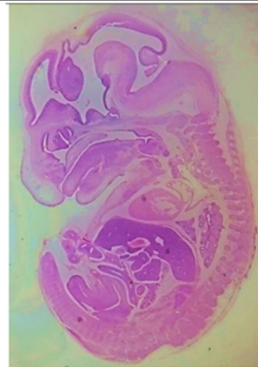
Embrión de ratón

Embrión de pollo equivalente a un embrión humano de mediados de la 4ª semana Identifique la médula espinal en desarrollo, las somitas y el neuroporo posterior.