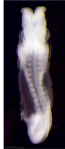
Embrión de humano de la 4ª semana vista Vista dorsal.

Identifique el neuroporo anterior y el área cardíaca.