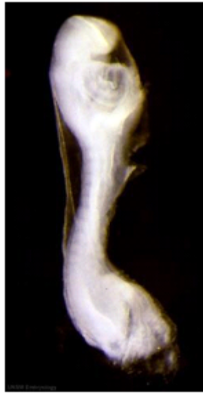
Embrión de humano de la 4ª semana vista Vista lateral.

Identifique el neuroporo anterior y el área cardíaca.