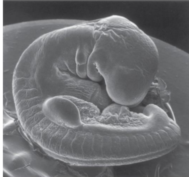
Embrión humano de 30 días (4 mm) con 34 somitas (microscopía electrónica de barrido)

From Jansen JE Atlas of human prenatal morphogenesis, Amsterdam, 1983, Martinus Nijhoff