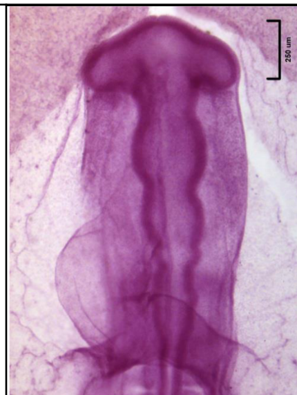
Embrión de pollo de 36-38 h equivalente a un embrión humano de mediados de la 4 a semana.

Identifique las capas blastodérmicas, el tubo neural, la notocorda y las aortas dorsales